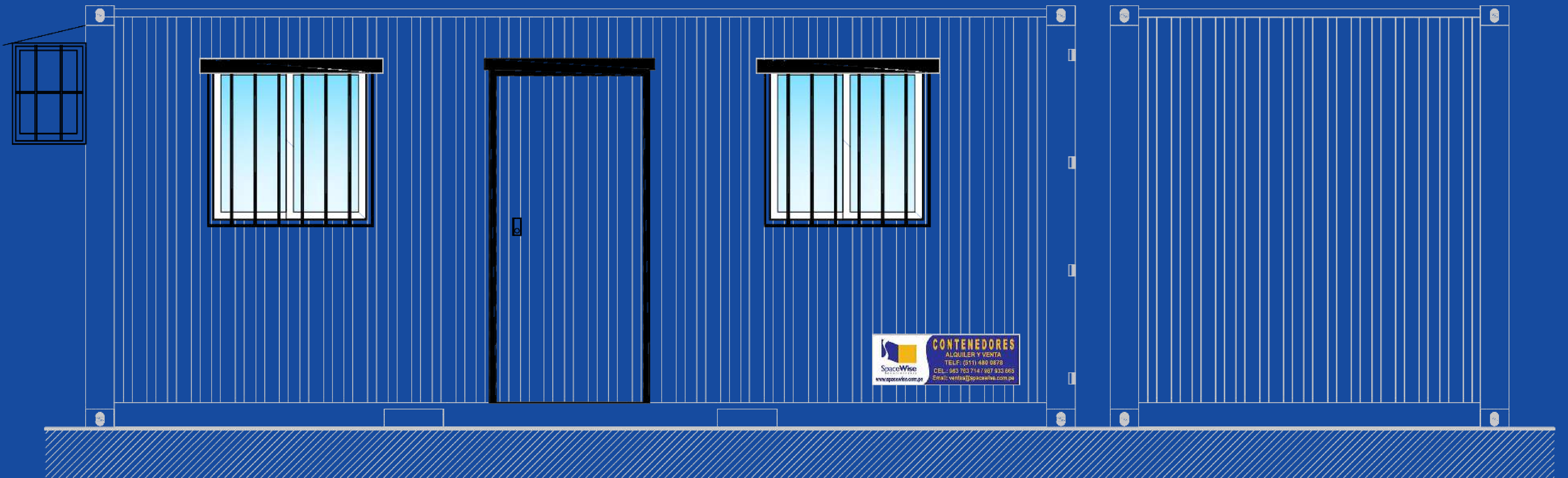
ELEVACION DE FACHADA

La ubicación de la puerta y ventana según requerimiento del cliente (sin costo adicional) no incluye mobiliario